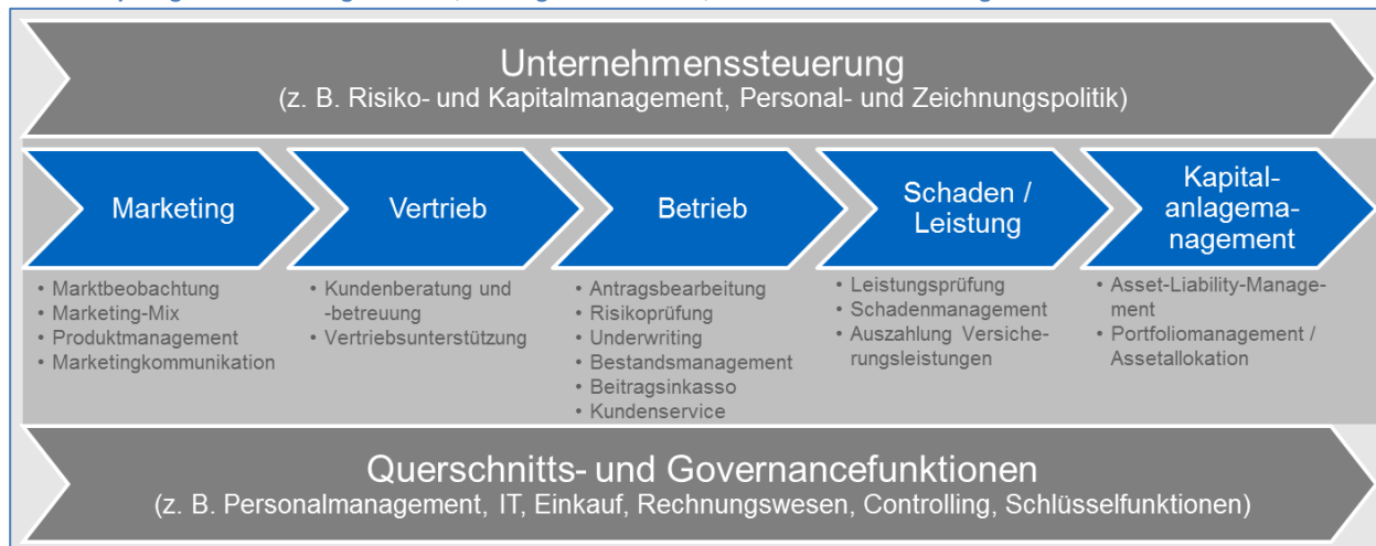
Wertschöpfungskette mit ausgewählten, wichtigen Aktivitäten; vereinfachte Darstellung

Die von dieser nichtfinanziellen Erklärung umfassten Themenfelder Umwelt-, Arbeitnehmer- und Sozialbelange sowie Achtung der Menschenrechte und Bekämpfung von Korruption und Bestechung sind eng mit der Wertschöpfungskette unserer Versicherungsunternehmen verbunden, die in der folgenden Abbildung vereinfacht dargestellt wird.