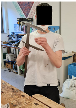
Einer der Jugendlichen bei einer Übung zur Arbeit mit Holz.

Auch ein Ausflug zur Berufsfeuerwehr in Nürnberg Hafen ist angedacht.