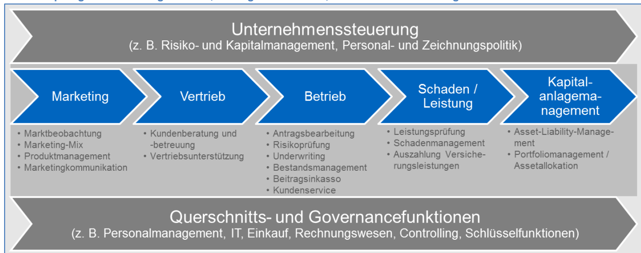
Wertschöpfungskette mit ausgewählten, wichtigen Aktivitäten; vereinfachte Darstellung

Die von dieser nichtfinanziellen Erklärung umfassten Themenfelder Umwelt-, Arbeitnehmer- und Sozialbelange sowie Achtung der Menschenrechte und Bekämpfung von Korruption und Bestechung sind eng mit der Wertschöpfungskette unserer Versicherungsunternehmen verbunden, die in der folgenden Abbildung vereinfacht dargestellt wird.